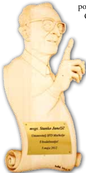
Spominsko obeležje na steni Janežičeve dvorane

Z dobršno župnikovo pomočjo se leta 1995 popolnoma obnovi Mladinski dom , ki mu domačini pravimo »stara šola«. Zgornja dvorana te nove zgradbe se leta 2012 poimenuje po zaslužnem duhovniku dr. Stanku Janežiču. Za vzdrževanje župnišča, urejanje zemljišča ob njem in na Metežici sploh je briga nekaterih požrtvovalnih mož, predvsem članov SPD Mačkolje.