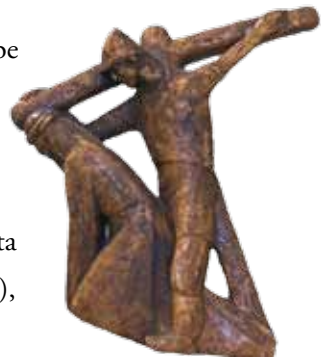
Goršetov „Križev pot“, 9. postaja

reliefne podobe križevega pota, delo akademskega kiparja Franceta Goršeta (1981),